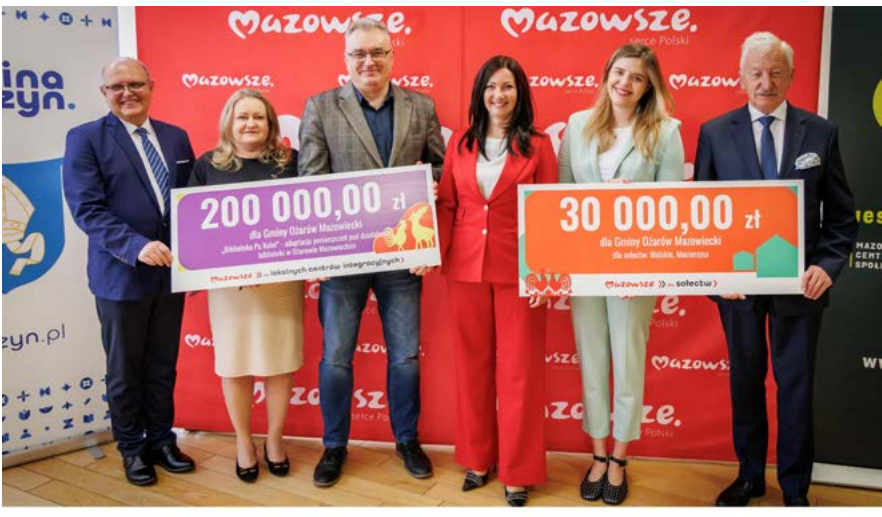
Mazowsze >> dla lokalnych centrów integracyjnych > Mazowsze >> dla sołectw >