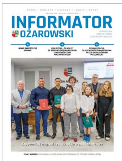
Okładka: Stypendia i nagrody za wysokie wyniki sportowe.