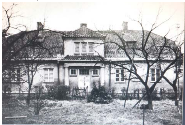
Budynek gospodarczy z 1921 roku przerobiony na dom mieszkalny. Zdjęcie z 1984 roku.

Ziemia ciągnęła się po obu stronach ulicy księcia Józefa Poniatowskiego aż do obecnej ulicy Sochaczewskiej. Była nazywana Zientarówką. Na tej ziemi wyrastały w późniejszych latach domy mieszkalne i obszar zabudowany nosił nazwę osiedle Zientarówka.