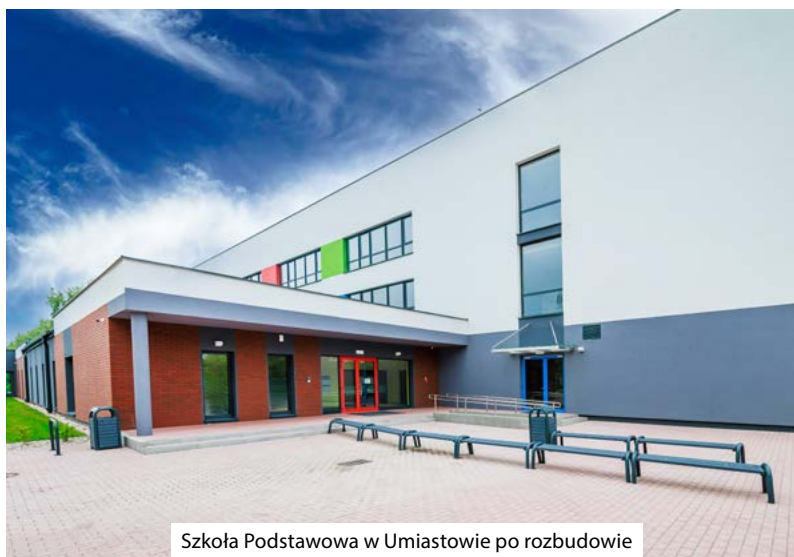
Szkoła Podstawowa w Umiastowie po rozbudowie

Zakończono również prace związane z rozbudową Szkoły Podstawowej w Umiastowie. W ramach zadania wykonana został budynek o trzech kondygnacjach, kubaturze 23.375,04 m 3 oraz powierzchni zabudowy 1.955,40 m 2 składający się z 17 sal dydaktycznych, sali informatycznej, biblioteki, dwóch pomieszczeń przeznaczonych na świetlicę, pokoju nauczycielskiego, stołówki, kuchni, szatni oraz pomieszczeń gospodarczych. Nowowymbudowana część szkoły przewiduje możliwość nauki dla 400 dzieci, a koszt wykonania obiektu wyniósł 24.463.979,96 zł.