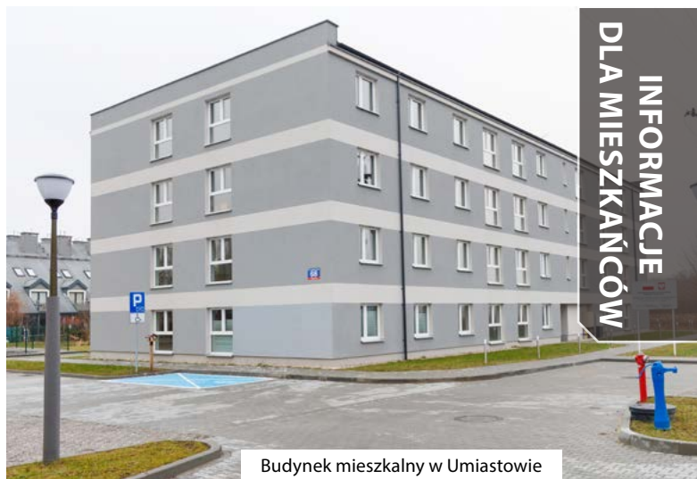
Budynek mieszkalny w Umiastowie

Drugie zadanie polegało na odbudowie przemysłowych budynków przy ulicy Fabrycznej 3 i 5. Obiekty zniszczone w wyniku m.in. pożarów, zostały kompleksowo zrewitalizowane. Powstały dwa budynki dwukondygnacyjne o powierzchni zabudowy 1140,38 m 2 , wraz z nowymi przyłączami do sieci ciepłowniczej, wodociągowej i kanalizacyjnej oraz zagospodarowaniem terenu przyległego. Całość przeprowadzonych prac wyceniono na kwotę 16.214.967,39 zł.