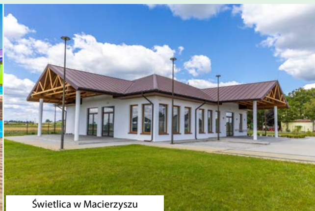
Świetlica w Macierzyszu