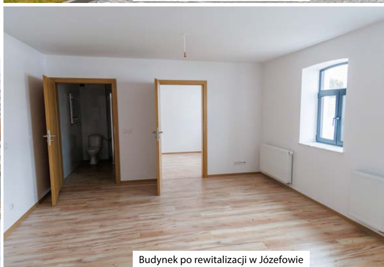
Budynek po rewitalizacji w Józefowie