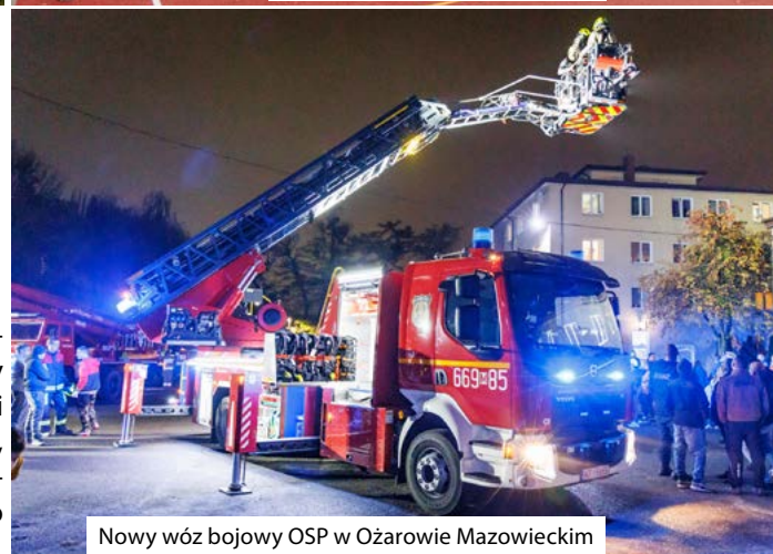
Nowy wóz bojowy OSP w Ożarowie Mazowieckim

W celu poprawy bezpieczeństwa na terenie gminy zakupiono samochód specjalny z drabiną mechaniczną SD30 dla Ochotniczej Straży Pożarnej w Ożarowie Mazowieckim. Wóz o długości 10,32 m, wysokości 3,24 m oraz wadze 16 ton z imponującą drabiną o zasięgu 30 metrów, został zaprezentowany przez Strażaków podczas imprezy okolicznościowej, podczas której można było zobaczyć możliwości zakupionego sprzętu. Koszt inwestycji 3.792.811,00 zł.