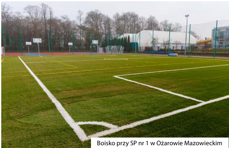
Boisko przy SP nr 1 w Ożarowie Mazowieckim

Zmodernizowane zostały również boiska szkolne przy Szkole Podstawowej nr 1 w Ożarowie Mazowieckim oraz przy Szkole w Płochocinie. Pierwsze z zadań obejmowało utylizację istniejącej nawierzchni oraz wykonanie nowych nawierzchni z poliuretanu oraz trawy syntetycznej dla bieżni, boiska do piłki nożnej oraz boisk uniwersalnych do siatkówki i koszykówki. Powierzchnia modernizowanych boisk wynosiła ok. 3720 m 2 . Dodatkowo wzdłuż boiska zainstalowane zostały piłkochwyty o długości ok. 260 mb. Modernizacja boiska przy Szkole w Płochocinie to wymiana nawierzchni na powierzchni 970 m 2 oraz wykonanie piłkochwyty o długości ok. 44 mb. Nowa poliuretanowa nawierzchnia pozwala na prowadzenie rozgrywek piłki ręcznej, siatkówki i koszykówki. Koszt modernizacji obu obiektów wyniósł 4.538.073,60 zł.