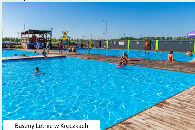
Baseny Letnie w Kręczkach