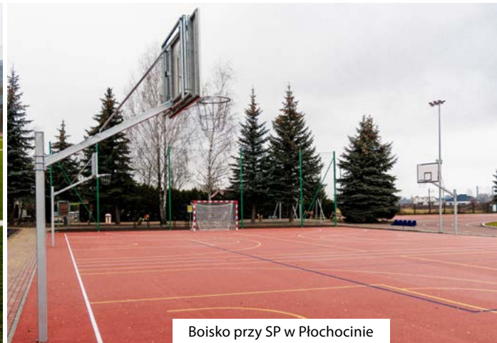
Boisko przy SP w Płochocinie