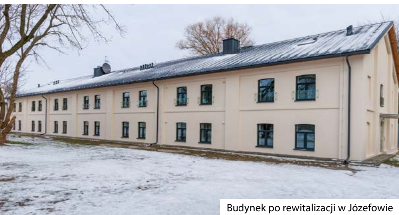
Budynek po rewitalizacji w Józefowie