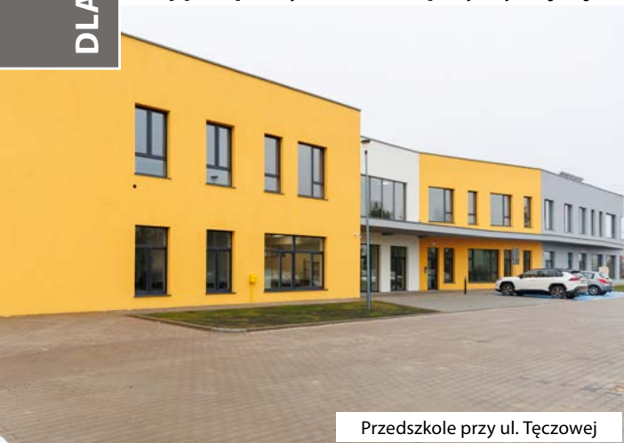
Przedszkole przy ul. Tęczowej

Początek nowego roku to czas pewnych podsumowań i planowania kolejnych działań w ramach gminnych inwestycji. W roku 2024 zakończono i rozpoczęto szereg zadań, które w dłuższej i krótszej perspektywie czasu, przyczynią się do zmiany warunków życia mieszkańców gminy.