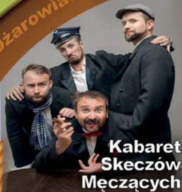
Kabaret Skeczów Męczących

Ożarowiacy Ożarowskie Kumoszki Wesole Wdówki