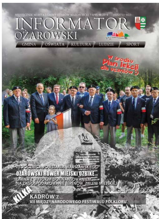
Okładka: Rocznicą wybuchu Powstania Warszawskiego